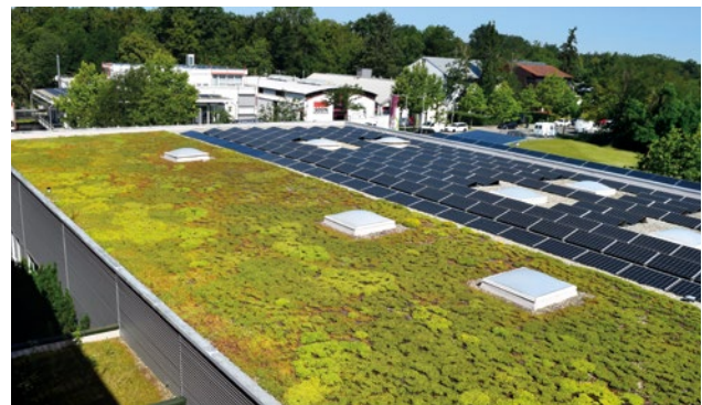
Abbildung 6: Konzept der räumlichen Trennung von Sonnenstromerzeugung und Dachbegrünung in Freiburg umgesetzt.

Mit der örtlichen Trennung von Solar- und Gründach kann auch ein intensives Gründach ohne Probleme realisiert werden.