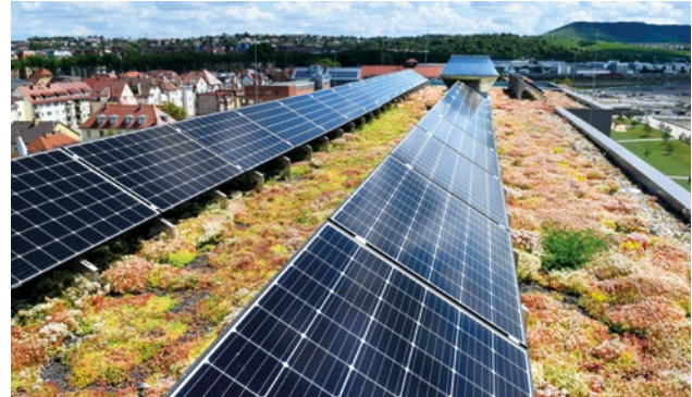
Abbildung 3: Photovoltaik und Gründach sind unmittelbar auf der selben Fläche verbunden. Hier sind die Module in eine Richtung ausgerichtet.

Grundsätzlich sollte bei der Kombination von PV und Gründach – die unmittelbar verbunden sind – ein niedriger Substrataufbau und entsprechend kleinwüchsige Bepflanzung realisiert werden. D.h. ein extensives Gründach, damit der Bewuchs keinen Schattenwurf erzeugt und der Pflegeaufwand möglichst gering bleibt.