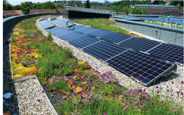
Abbildung 5: Konzept der räumlichen Trennung von Solar-Anlage und Gründach – hier auf dem kommunalen Gebäude der Stadt Tübingen.

Im Regelfall wird dennoch auf einen hohen Bewuchs verzichtet, da dieser eine erhöhte Pflege in Anspruch nimmt.