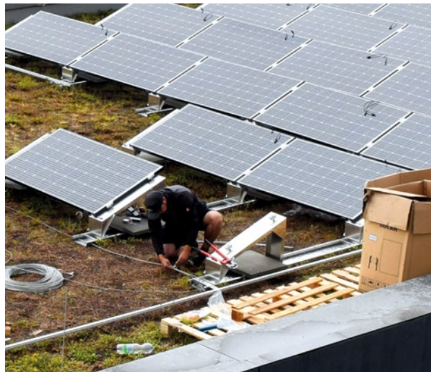
Abbildung 7: Montage einer PV-Anlage auf ein bestehendes Gründach.