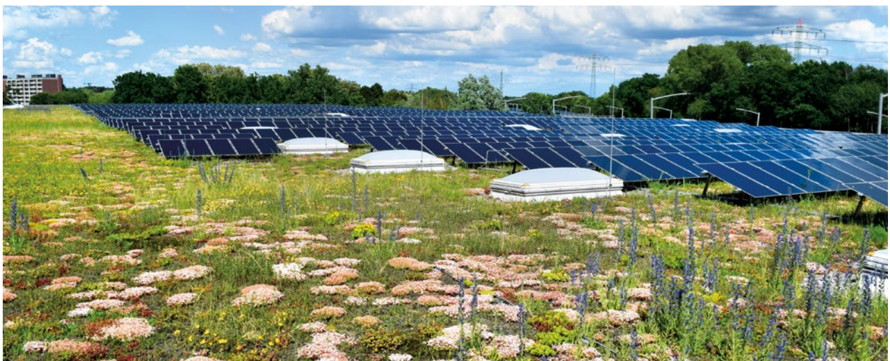
Abbildung 2: Da freut sich Biene und Co – Artenvielfalt auf einem Solar-Gründach.