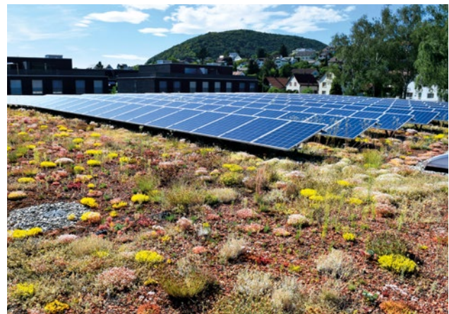
Abbildung 4: Extensive Dachbegrünung in Kombination mit PV-Anlage.

Wichtig, extensive Begrünungen sind nur im Rahmen der Instandhaltung begehbar. Sie dienen mit ihrer möglichst geschlossenen Vegetationsdecke in erster Linie als ökologischer Ausgleich überbauter Natur, insbesondere in stark versiegelten Räumen wie etwa Ballungsgebieten.