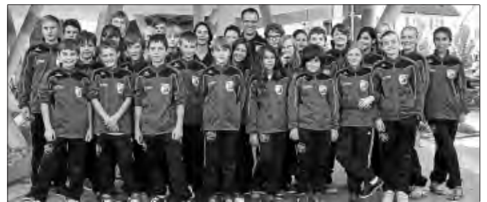
Die Handballjugend mit den neuen Trainingsanzügen

Pünktlich zu den ersten Spieltagen der neuen Saison ging sie über die Bühne, die Verteilung der bestellten neuen einheitlichen Trainingsanzüge. Initiiert von einer Spielermutter, die die Organisation der Bestellung in Abstimmung mit Abteilungsleitung und Förderverein übernommen hatte, konnte für ca. 50 Spielerinnen und Spieler der Jugendklassen D bis B neue einheitliche Trainingsanzüge bestellt werden. Sehr zu Freude der Abteilung hat sich der Förderverein mit einer großzügigen finanziellen Unterstützung eingebracht und dadurch auch die Geldbeutel der Eltern entlastet. Im Namen aller Spieler/innen, Eltern und der Abteilung ein herzliches Dankeschön dafür . Somit war es auch kein Problem mehr, das Vorhaben "die TSF geben an den Spieltagen ein einheitliches Bild ab" in die Tat umzusetzen. Die Freude und die leuchtenden Augen der Kinder und Jugendlichen bei der Ausgabe am Freitag, den 30.09. im TSF Sportcenter sprachen ihre eigene Sprache und sind für die Organisatoren der entsprechende Dank für ihre Mühen. Allen Mannschaften wünschen wir einen guten Start in die neue Saison und mit dem Anzug viel Freude.