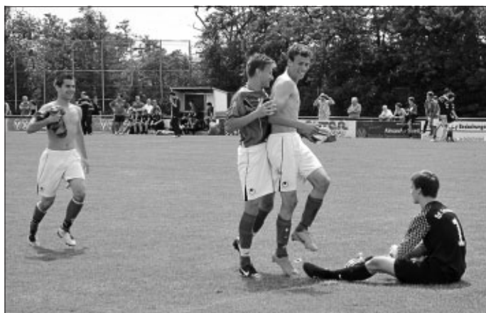
Sekunden nach dem Abpfiff - unbeschreiblicher Jubel bei den Ditzinger Spielern