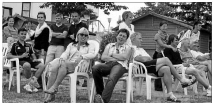
Die Zuschauer und Fans des TC Heimerdingen.

Im Gleichklang mit dem Landesliga-Aufstieg des TSV Heimerdingen (Glückwunsch von allen Tennisclubblüblern!) zeigt auch der Tennisclub einen klaren Trend nach oben. Den Kern bilden 4 Herrenmannschaften mit der Herren 1 in der Württembergstaffel. Es folgen die Damen, Damen 40, Damen 50, Knaben, Junioren, Herren 40, Herren 55, VR-Talentiade U 10 und die Hobby Staffeln Mixed 50. Der absolute Knaller sind aber die zahlreichen Zuschauer auf dem Heimerdingen Centre Court mit seiner Sonnenterrasse und engagierten Bewirtungscrews. Allen ehrenamtlichen Helfern und Betreuern ein herzliches Dankeschön.