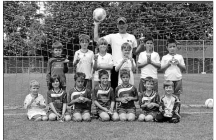
Die Turniersieger und viertplatzierten Heimerdinger in Rohr