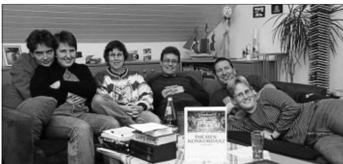
Der Hauskreis Haist

Wir treffen uns jeden Donnerstag um 19:00 Uhr und starten erst mal mit einem leckeren gemeinsamen Essen. Wenn dann der Leib gut versorgt ist, gibt's ein Bibelthema, damit auch Seele und Geist nicht zu kurz kommen. Und da so ein Donnerstagabend immer wie im Flug vergeht, nutzen wir auch schon mal ein ganzes Wochenende, um Bibelstudium und Gemeinschaft zu vertiefen.