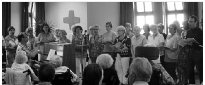
Der City-Chor in Aktion

Wir danken dem Chor für diese schöne sommerliche Liederinlage, die bei allen gut angekommen ist und eine schöne Bereicherung für uns alle war.