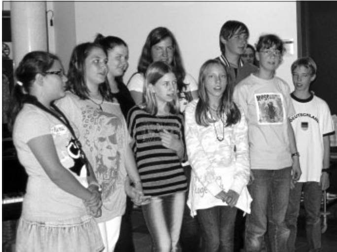
Der kleine Chor aus der THS