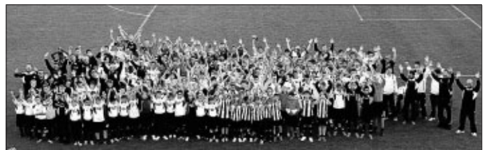
Das Juniorteam Ditzingen - eine starke Gemeinschaft

Das Juniorteam Ditzingen hat das Ziel, Kinder und Jugendliche sowohl sportlich als auch in der Persönlichkeitsentwicklung bestmöglich auszubilden. Deshalb versteht sich das Juniorteam als eine große Gemeinschaft, in der gegenseitiger Respekt und Unterstützung groß geschrieben wird. Diese Philosophie berücksichtigen auch die Trainer in der alltäglichen Trainingsarbeit. Um dies auch nach außen zu verdeutlichen, trafen sich letzten Freitag alle Mannschaften der D- bis A-Junioren zum gemeinsamen Fototermin. Unsere Fotografin Gabi Mack war in ihrem Element und den Jungs hat es richtig Spaß gemacht.