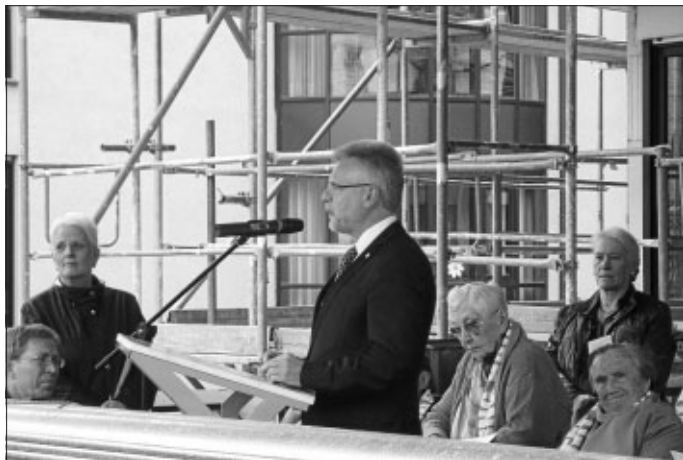
Grußwort OB Makurath