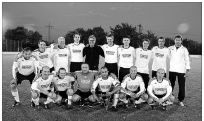
AH nach der Wimpel-Übergabe zu Staffelleisterschaft

Sonntag, 30. September 2012, 10:30 Uhr: Strohgäu Power Markgröningen - SVGG (in Markgröningen)