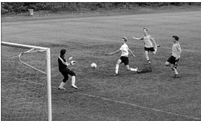
Dem ständigen Druck konnte Eltingen auf Dauer nicht standhalten

Nach der Halzeitpause hat sich am Spiel auf ein Tor nichts geändert, so dass unsere Jungs weiter zu zahlreichen Torchancen kamen und diese zum Teil auch zum hoch verdienten 5:1 verwandeln konnten. Weiter So Jungs.