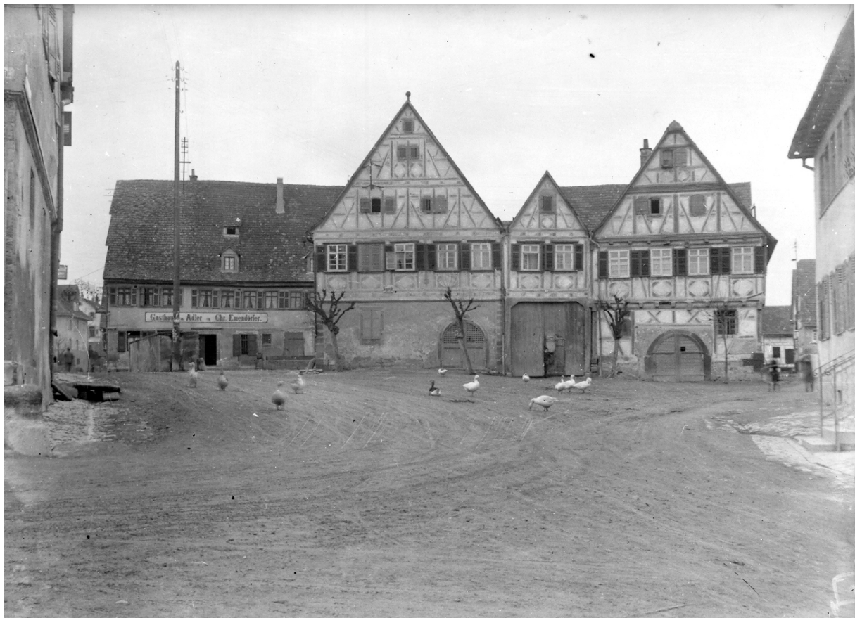
Der Laien um 1930

Bis 1986 Knotenpunkt der Straßen Leonberg - Müchingen/Weil im Dorf - Weissach. 1989 Umbau zu einem modernen Platz mit Tiefgarage und Verwaltungszentrum mit Bürgersaal. 1993 Stadtbibliothek im „Dreigiebelhaus“, Haus der Sozialen Dienste im alten Schulhaus, Stadtmuseum im Alten Rathaus im Alten Rathaus von 1739.