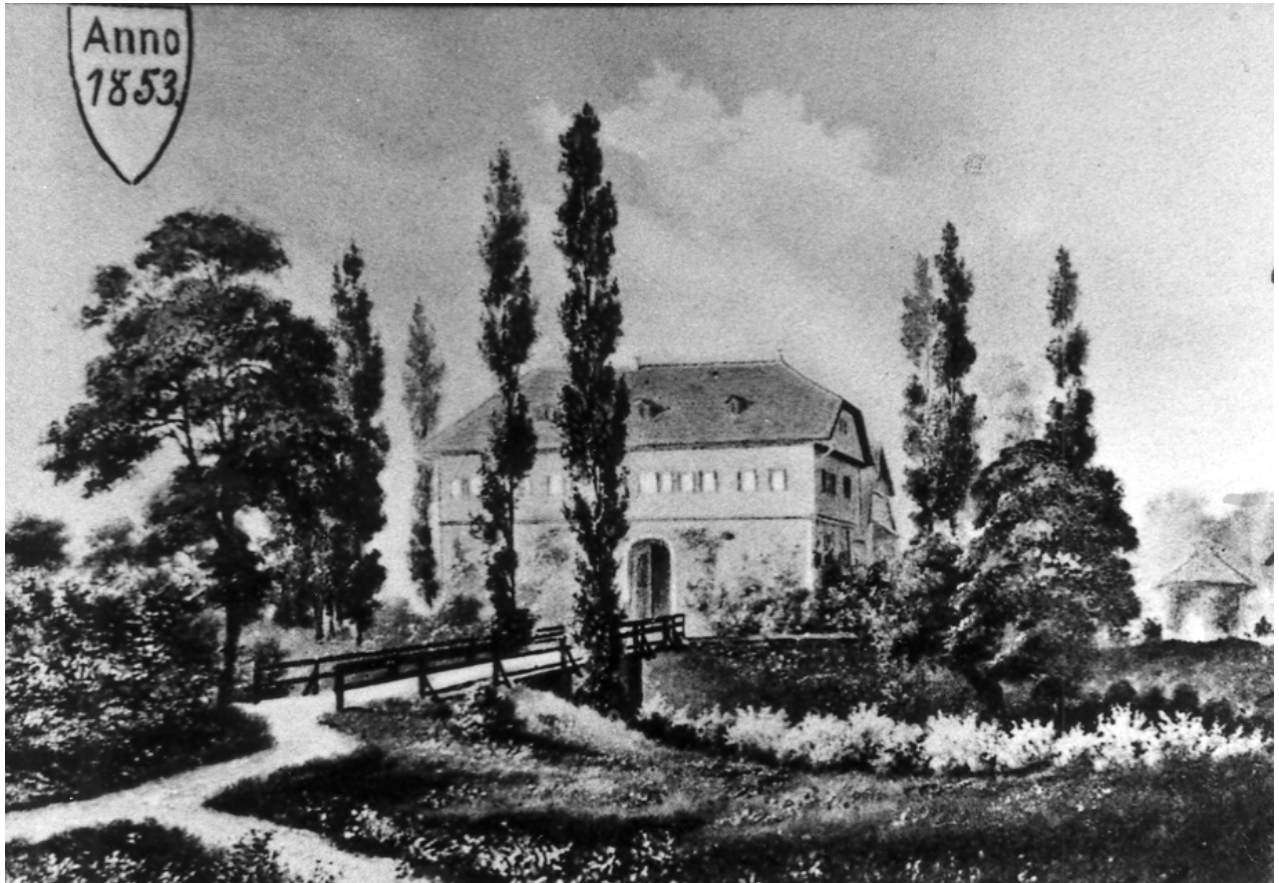
Ditzinger Schloss, Zeichnung um 1850