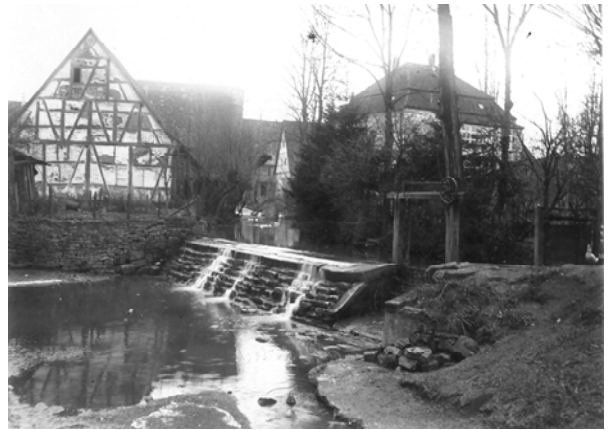
Glemsstraße mit Zehntscheuer und Stauwehr 1952/1930

Informationen: Stadtarchiv Ditzingen Am Laien 4 71245 Ditzingen Tel. : 07156 164308 Mail: hoffmann@ditzingen.de