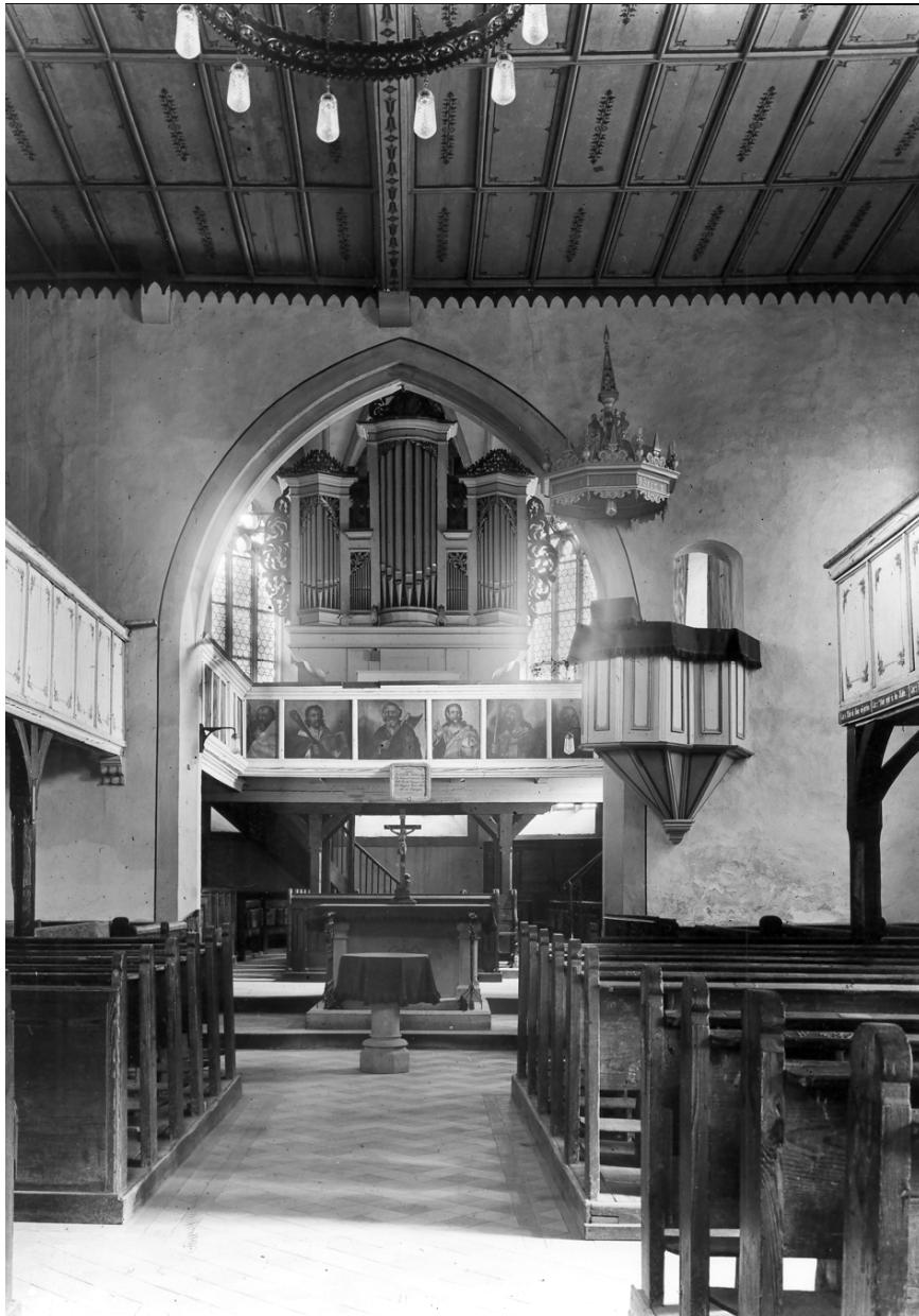
Konstanzer Kirche: Innenansicht 1925